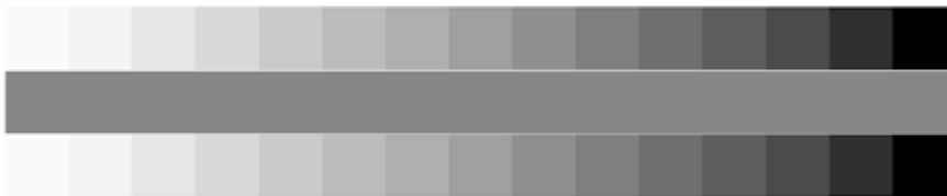
Abb. 1: Wirkung eines Umfeldes verschiedener Helligkeit (oben und unten) auf die Farberscheinung eines gleichmäßigen, mittleren Graus (Mitte).

der dunklen Graustufen verschwindet die scheinbare Verschwärzlichung des mittleren Streifens, weil das Auge die Helligkeit auf die dunkle Umgebung bezieht. Steht dagegen das Grau [oder eine Farbe] in heller Umgebung, so wird die scheinbare Verschwärzlichung deutlich sichtbar. Die im Mittel geringste Beeinflussung des Hintergrunds auf die Wahrnehmung typischer Vorlagen, die Helligkeits- und Farbbereiche im gesamten Tonwertbereich aufweisen, tritt demnach bei einem Grauumfeld mittlerer Helligkeit ein. Es sei bereits an dieser Stelle erwähnt, dass alle Farbabstandsformeln auf ein Umfeld mit wohl definierter Graustufe bezogen sind.