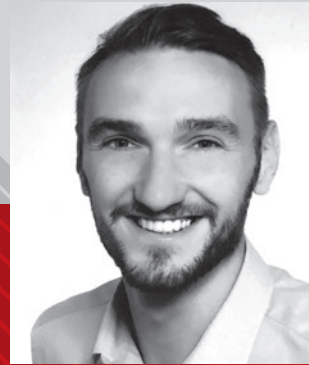
Artur Wall Colordruck Baiersbronn